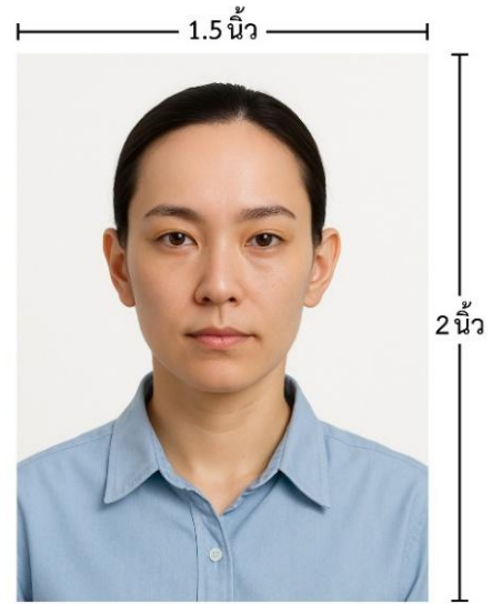
ขนาดรูปตัวอย่างใช้ยื่น Visa

*** ห้ามขีดเขียน แม็ก หรือใช้คลิปลวดหนีบกระดาษ ซึ่งอาจส่งผลให้รูปถ่ายชำรุด และไม่สามารถใช้งานได้ ***