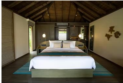
Mabin Beach Villa