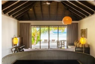
Dheru Beach Villa