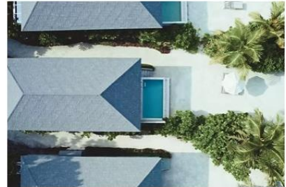
Mabin Beach Pool Villa