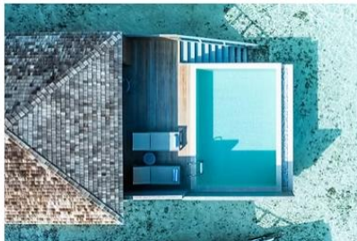
Dheru Water Villa