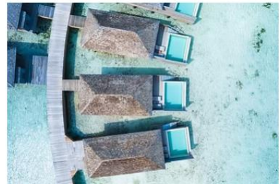
Mabin Water Pool Villa