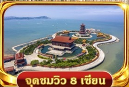
จุดชมวิว 8 เซียน