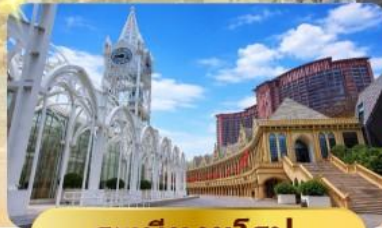
ระบียงยุโรป