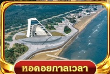
หอดอยกาลเวลา