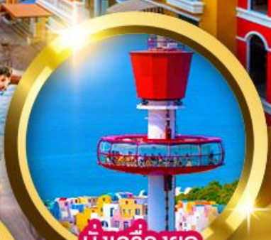
นั้งเครื่องยก Eagle Eye

"เวนิสแห่งเอเชีย" Grand World Phu Quoc สถาปัตยกรรมสไตล์ยุโรปหลากสีสัน