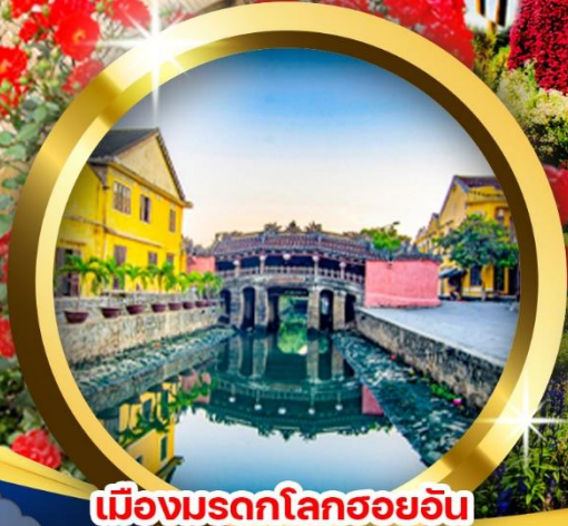
เมืองมรดกโลกฮอยอัน