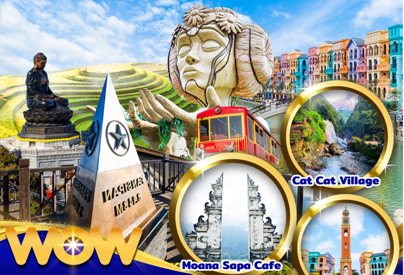
Cat Cat Village

ฮานอย • ซาปา • ฟานซีปัน • ลาวไก • เมก้าแกรนด์เวิลด์