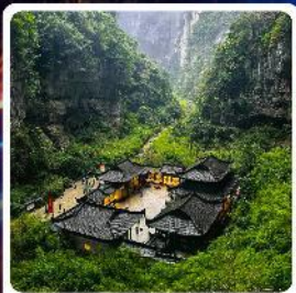
อุทยานแห่งชาติหลุมบ่อฟ้า

ไฮไลท์! อุทยานแห่งชาติหลุมบ่อฟ้า มกตกลอกระดับ 5A รถไฟฟ้าทะลุтик ตึกตะกียบ อลังการการแสดงสิงหยาตัง