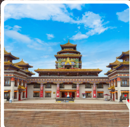
ทำเนียบพระลามะอูหลาน