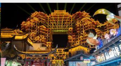
ตีทมห้ศจสรย 72