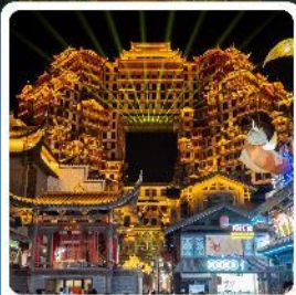
ตึกหอคจรรย 72