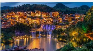
หมู่บ้านโบราณฟูหรงเจิน