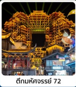
ตึกหอคจรรย 72