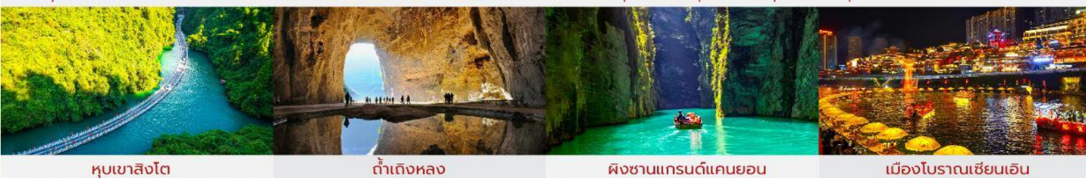
หุบเขาสิงโต