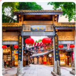
หมู่บ้านโบราณฉือซีโฮว