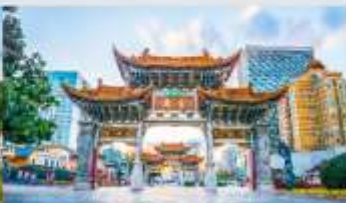
ประตูน้ำทองไถ่หยก