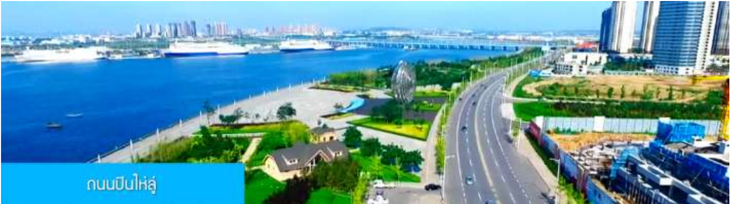
ถนนปินไห่ลู่

ล้อมด้วยตึกระฟ้าที่ทันสมัย ภายในมีบ่อน้ำพุดนตรี ลานหญ้าขนาดใหญ่ และลานกว้างสำหรับจัดกิจกรรม กลางแจ้ง อาทิ เทศกาลเบียร์นานาชาติ การแข่งขันวิ่งมาราธอน งานแฟชั่นนานาชาติเมืองต้าเหลียน ฯลฯ