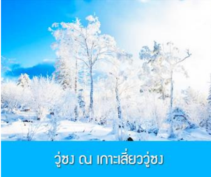
วู่ซง ณ เกาะลิ่ววู่ซง

พักที่ JILIN LUNWEIKE HOTEL โรงแรมระดับ 4 ดาวท้องถิ่นหรือเทียบเท่า ในเมืองจีหลิน