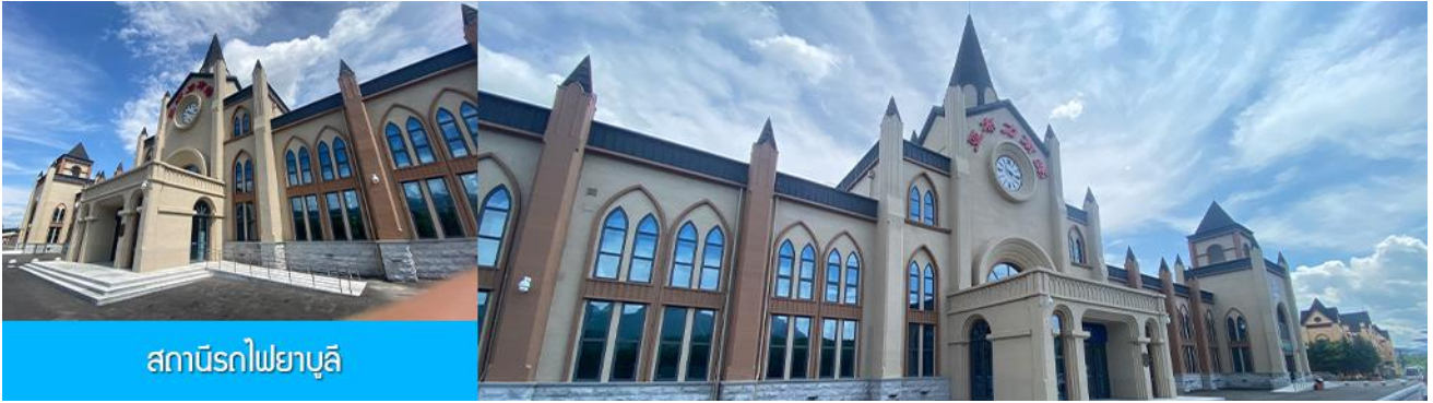
สถานีรถไฟยูลี

นำท่านเที่ยวชม สถานีรถไฟยูลี 亚布力南站 (ชมด้านนอก) ได้ชื่อว่าเป็นสถานีรถไฟที่สวยงามที่สุดของจีน โดดเด่นด้วยสถาปัตยกรรมแบบตะวันตก ให้ท่านเก็บภาพบรรยากาศความสวยงามของสถานีรถไฟที่ปัจจุบันยังคงเปิดให้บริการอยู่