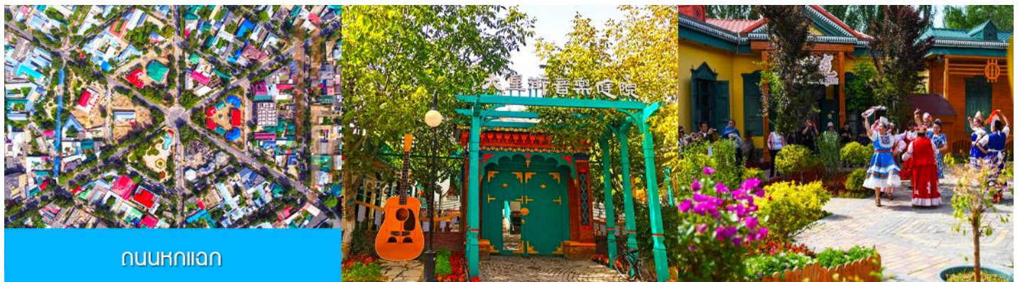
ถนนหกเหลี่ยม

จากนั้นนำท่านเดินทางสู่ เมืองอิหนิง 伊宁 (ระยะทาง 200 กม. ใช้เวลาเดินทางราว 3 ชั่วโมง)