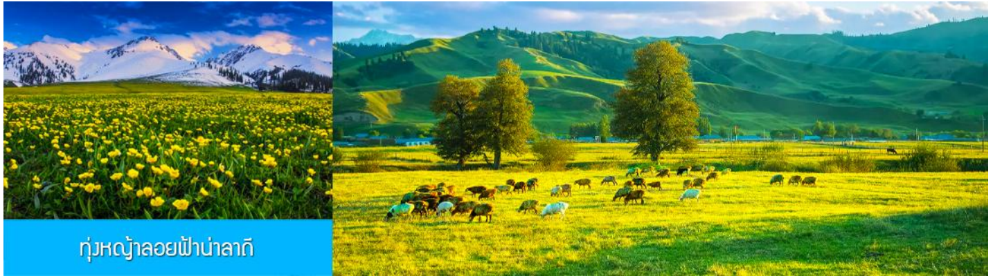
ทุ่งหญ้าลวยฟ้านาลาตี

พักที่ WAN SEN HOTEL ระดับ 4 ดาวท้องถิ่นในตำบลนาลาตี