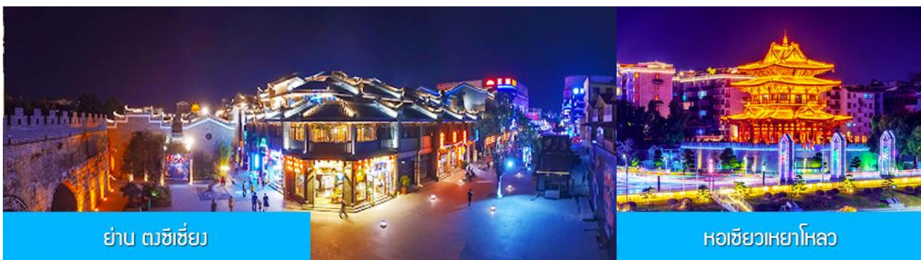
ย่าน ดงซีเซียง