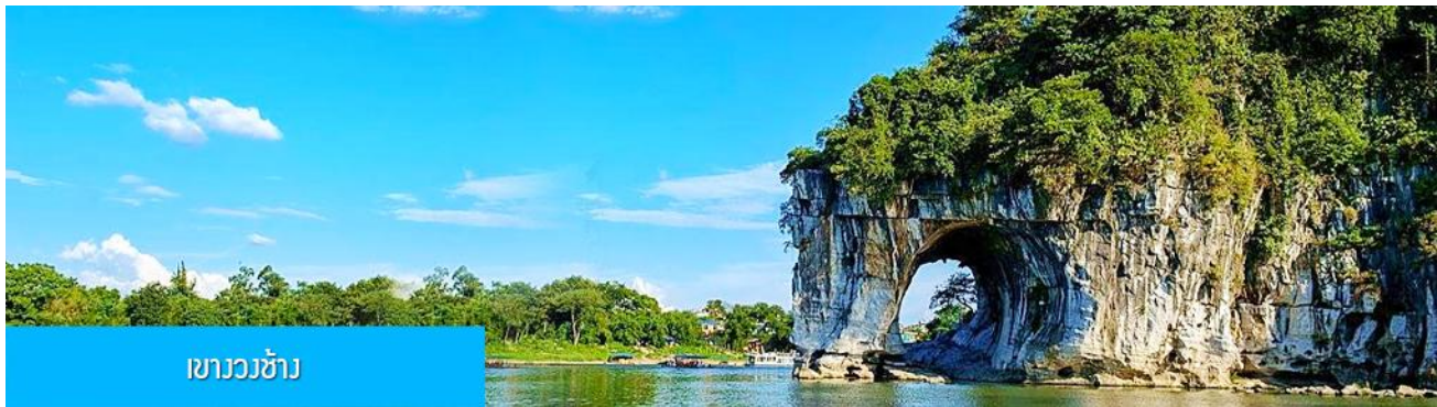
เขาวงช้าง

รับประทานอาหารกลางวัน ณ ภัตตาคาร (มื้อที่ 7)