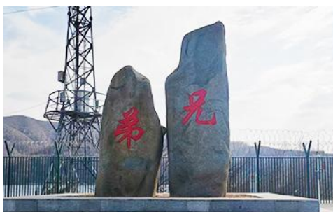
ป้ายพรมแดนจีนเกาหลีและแท่งศิลาสองพี่น้อง