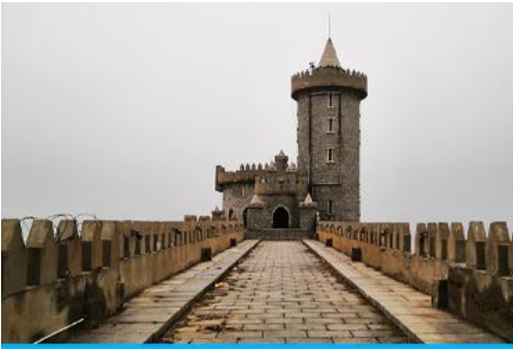
คาเฟ่อัสดง