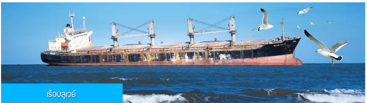
เรือบลูเวย์

เที่ยง รับประทานอาหารกลางวัน ณ ภัตตาคาร (5)