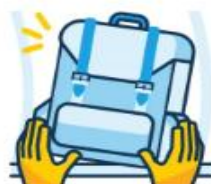
Cabin Baggage 7 kg