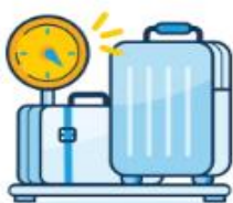
Check-in Baggage 23 kg