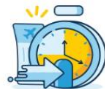
Check-in Time Limit 1 hour before departure