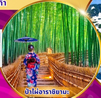
ป่าไฟอาราชิยามะ

พิเศษ! แอ้ออนเซ็น นั่งเคเบิลคาร์ ชมวิวภูเขาแอลป์