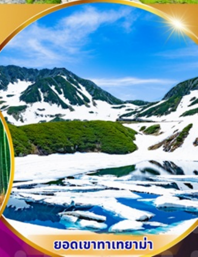
ยอดเขาทาเกยาม่า

พักรีสอร์ท 3 ดาว ★★★★★ ฟรี ประกันอุบัติเหตุ บริการอาหารท้องถิ่น