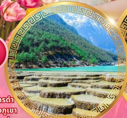
ทะเลสาบไป๋สยเหอ

วัดชงจันหลิน ช่องแคบเสื่อกระโจน สระมังกรดำ เมืองโบราณลี่เจียง ภูเขาหิมะมังกรหยก ชมวิวภูเขา หิมะที่ร้าน Yun di ta ชมดอกไม้ที่สวนอุทยานชุ่ม น้ำโกวหนาน ชมดอกซากุระสวนหยวนทง