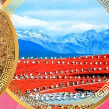
ความประทับใจแห่งลี่เจียง