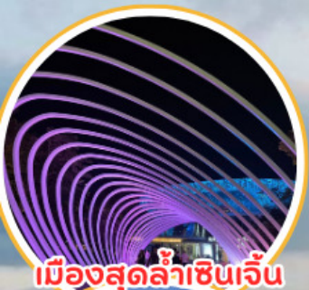
เมืองสุดล้าเซ็นเจิ้น