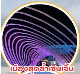
เมืองสุดล้ำเซินเจิ้น