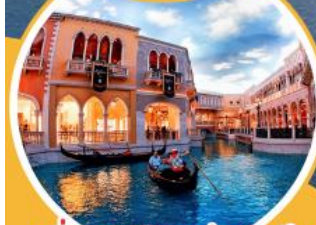
เที่ยวเวนิสแห่งเอเชีย