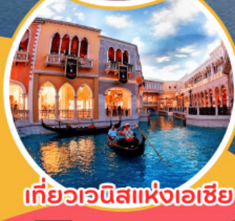
เที่ยวเวนิสแห่งเอเชีย