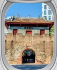
เมืองโบราณหนาวโก