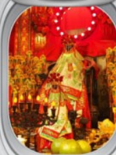
วัดเจ้าแม่กวนอิมสองฮา