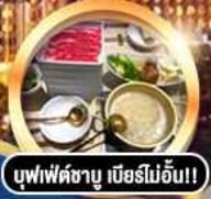
บุฟเฟ่ต์ชาบู เบื่อไม่อั้น!!