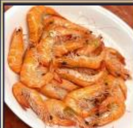
กุ้งหวานลวก