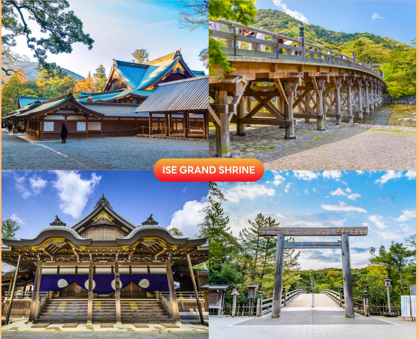
ISE GRAND SHRINE

นำท่านสู่ ศาลเจ้าอิเซะ (Ise Grand Shrine) หนึ่งในศาลเจ้าชินโตที่ศักดิ์สิทธิ์ที่สุดสำหรับชาวญี่ปุ่นตามหลักศาสนาชินโต ธรรมชาติรอบตัวล้วนมีเทพสถิตอยู่ และ ณ ศาลเจ้าอิเซะแห่งนี้เป็นที่ประทับของเทพเจ้าสูงสุด คือ อะมะเตะระสุ โอะมิคะมิ (Amaterasu Omikami) หรือเทพีแห่งแสงอาทิตย์ ต้นกำเนิดของศาลเจ้าอิเซะนั้นไม่ทราบแน่ชัด มีตำนานเล่าว่ากว่าสอง พันปีที่แล้ว เจ้าหญิงองค์หนึ่งได้ออกเดินทางแสวงหาสถานที่เพื่อเป็นที่ประทับของเทพีอะมะเตะระสุ จนได้ยินเสียงบอก ความประสงค์ถึงสถานที่ตั้งศาลเจ้าในปัจจุบัน ( การเปลี่ยนสีของใบไม้ ขึ้นอยู่กับสภาพอากาศเป็นสำคัญ )