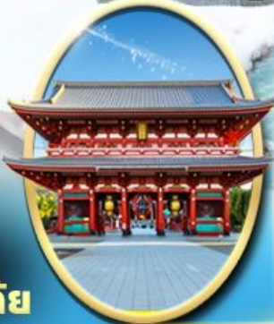
วัด เซ็นโซจิ

ถนนทานานิฮะ ซัปโปะชิโนะจุกุ ตลาดอะเมะโยโกะ ตลาดเช้า มิยาซากาวะ ถนนซันมาจิซุกุ สะพานนาคาบาชิ