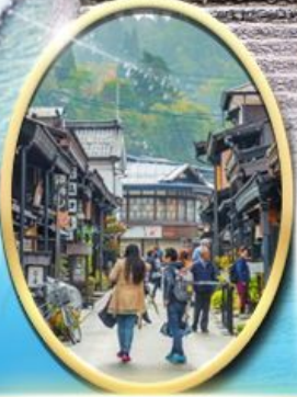
เมืองเก่า ทาคายามา