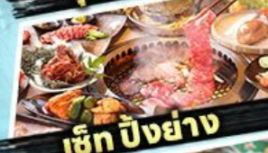
เซ็ท ปิงย่าง