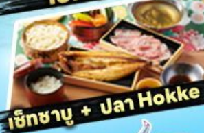
เซ็ทซาบู + ปลา Hokke