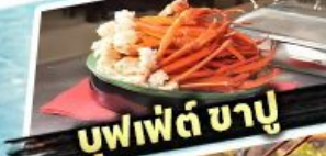
บุฟเฟต์ ซาบู