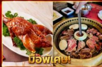
บ๊อฟเตซี่! เปิดอย่างอ่องกง บุฟเฟ่ต์ปึงย่างเกาสี