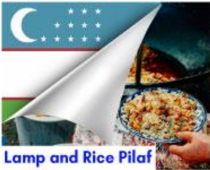
Lamp and Rice Pilaf