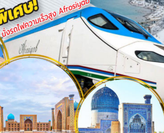
จัตุรัสเรจิสถาน