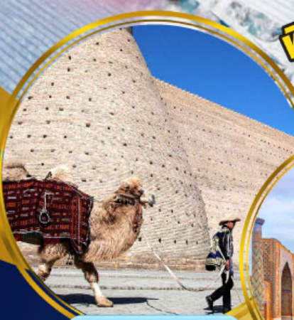
บ้อมปราสาทบุคาร่า