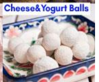
Cheese & Yogurt Balls