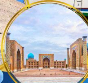
จัตุรัสเรจิสถาน