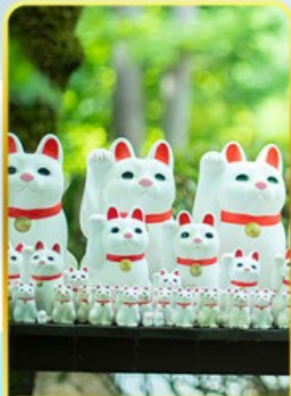
วัดโกโตคุจิ(วัดแมว)