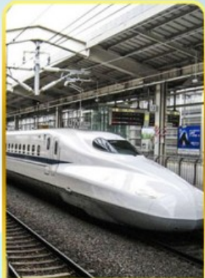
ทดลองนั่งชินคันเซน