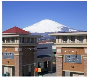
โกเท็มมะเจ้าท์เค็ต