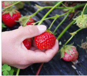
เก็บสตอเบอร์รี่