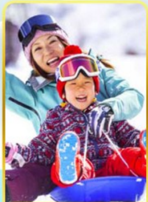
กิจกรรมลานสกีฟูจิ