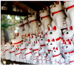
วัดโคโตคุจิ(วัดแมว)