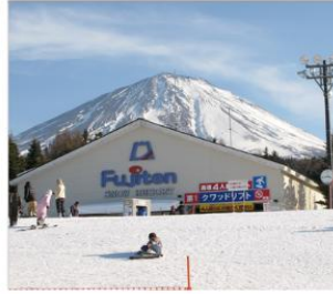
กิจกรรม ณ ลานสกี