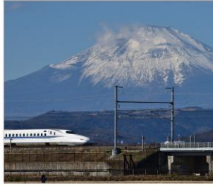
ทดลองนั่งชินคันเซน