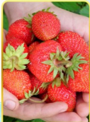
กิจกรรมเก็บสตอเบอร์รี่