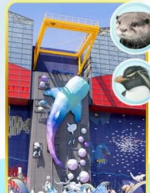
พิพิธภัณฑ์ไคยุคัง