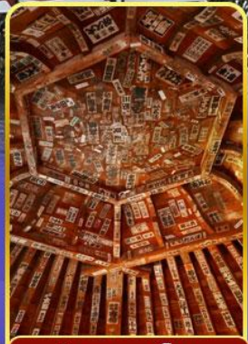
วัดซาชะเอโดะ