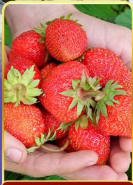
กิจกรรมเก็บสตอเบอรี่