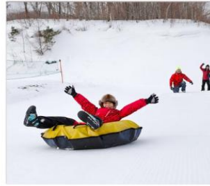
เล่นสโนว์ทูป