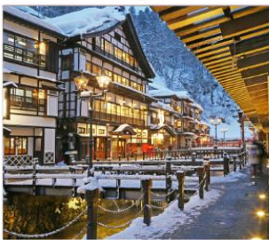
กินชงออนเซน