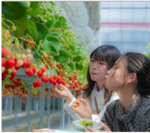
เก็บสตอเบอร์รี่นิกโก้