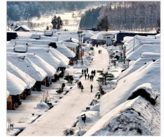
หมู่บ้านโบราณโออูจิจุด