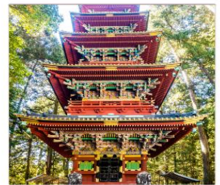
ศาลเจ้าโทโชกุ

THAI สายการบินไทย บริการทุกระดับประทับใจ FULL SERVICE