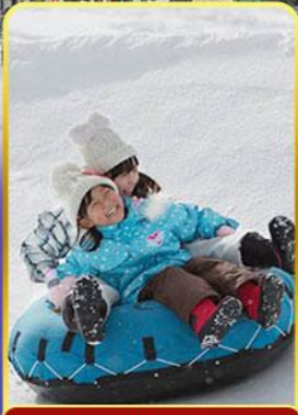
กิจกรรม ぬ ลานสกี