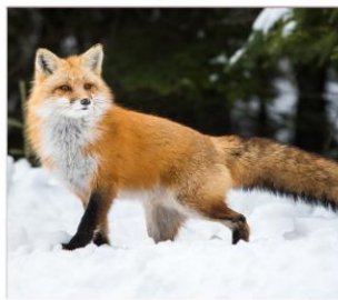
หมู่บ้านสุนัขจิ้งจอก