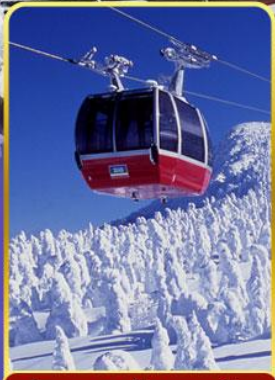
นั่งกระเช้าขึ้นเขาซาโอะ