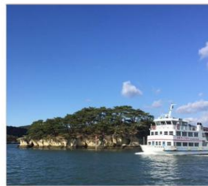
ล่องเรืออ่าวมัตสึชิม่า