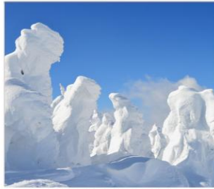
SNOW MONSTER ปีศาจหิมะ