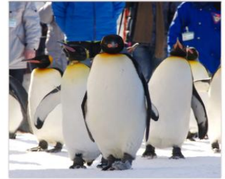
ชมพาเหรดแพนกวิน