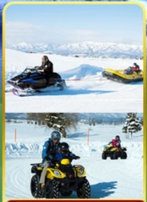
BIBAI SNOW LAND