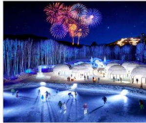
หมู่บ้านน้ำแข็งโทมามู