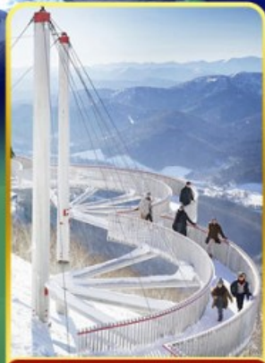
ระเบียงหมอกน้ำแข็ง