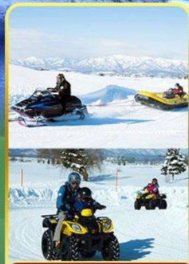
BIBAI SNOW LAND