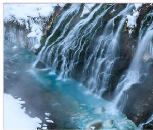
น้ำตกชิราฮิเกะ