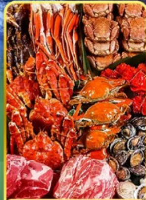
บึงย่างพรี่เมี่ยมมันตะ