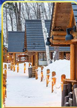
มิงเกิ้ลทอโร