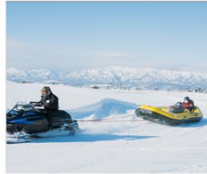
กิจกรรมบีโคโนว์แลนด์