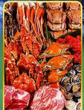
ปิ้งย่างพรีเมียมมันตะ