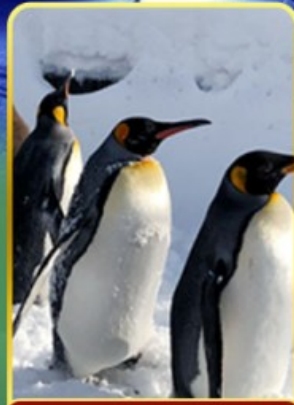
พาครอบครัวไปชม