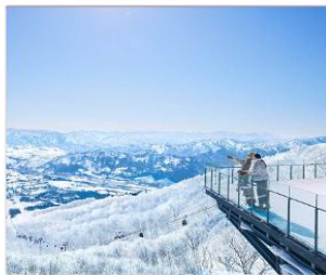
ชมวิวFOREST OF TREE