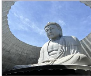
HILL OF BUDDHA