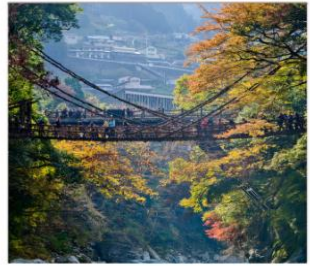
ชมสะพานคะซึระมาชิ