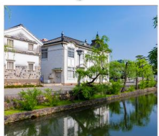
เขตอนุรักษ์เมืองเก่า คุราชิกิ