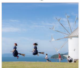
Shodoshima Olive Park เกาะมะกอก