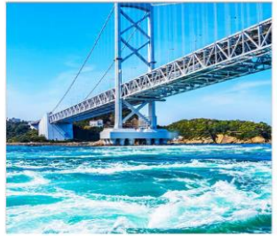
ช่องแคบนารุโตะ