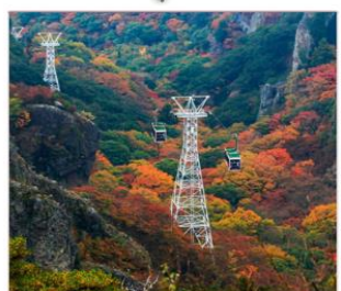
นั่งกระเช้าชมเขา ดังคาเคอิ