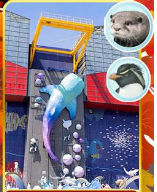
พิพิธภัณฑ์โคยูกัง

ออนเซ็น 2 คับ มน.กระเป๋า 23 กก.X2 8Days 5Night