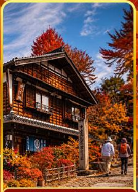
หมู่บ้านมาโกเมะจุกุ