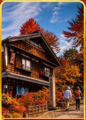
หมู่บ้านมาโกเมะจุกุ