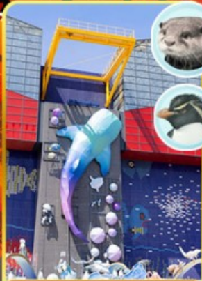
พิพิธภัณฑ์โคคุคัง