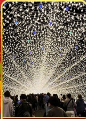
นาบะนะโนะซาโตะ