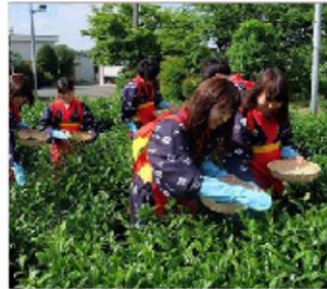
กิจกรรมเก็มซา