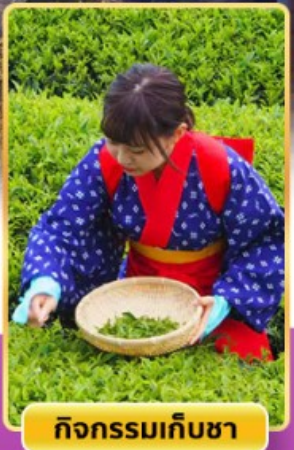
กิจกรรมเก็บชา