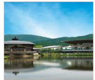
คารุยชาวาเจ้าทีเล็ท

THAI สายการบินไทย บริการทุกระดับประทับใจ FULL SERVICE