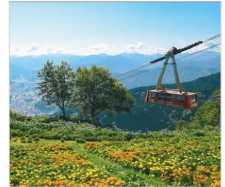
กระเช้าชูชาวาโดเอ็น