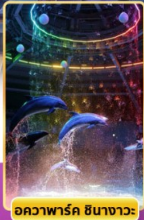
อควาพาร์ค ซินางาวะ