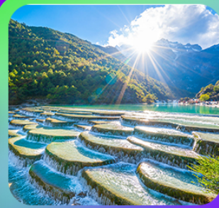
“ทะเลสาบโป๋ส่วยเหอ”