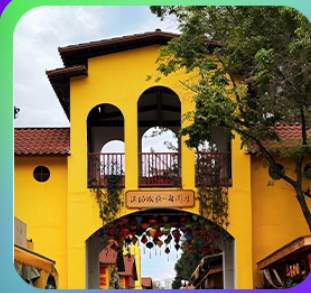
“หมาหยวนมิเตอร์กจ”