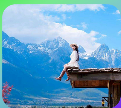
“กาแฟ Yun Di An Coffee”