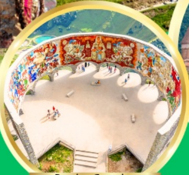
Russian-Georgian Friendship Monument