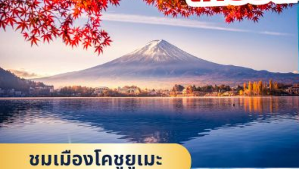
ชมเมืองโคชูยูเมะ