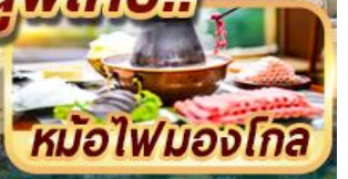
หม้อไฟมองโกเลีย