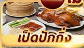
เป็ดปักกิ่ง