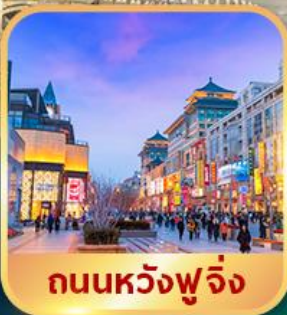
ถนนหวงฟู่จิ่ง