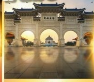
อนุสรณ์เจียงโตเซค