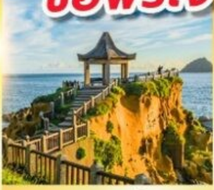
เกาะเหอผิง

พักย่านซีเหมินติง 2 คืน ขอพรเจ้าแม่กวนอิมพันมือ