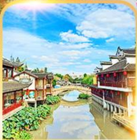
เมืองโบราณซีเป่า