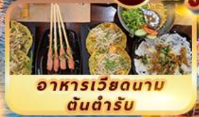
อาหารเวียดนาม ต้นตำรับ