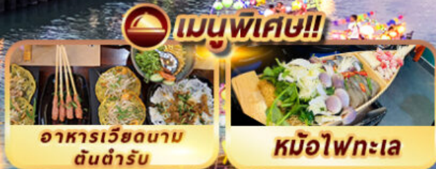
อาหารเวียดนาม ต้นตำรับ