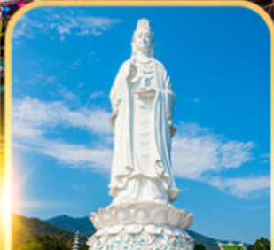
วัดหลินอิ่ง