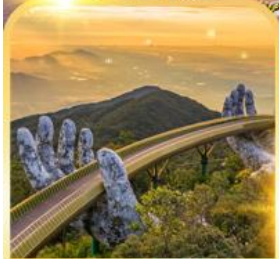
สะพานมือยักษ์