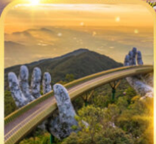
สะพานมือยักษ์

ดานัง ฮอยอัน บานาฮิลล์ เที่ยวบานาฮิลล์เต็มวัน รวมบัตรเครื่องเล่น