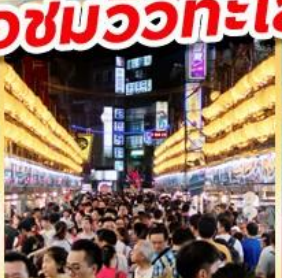
โด่งไนท์มาร์เก็ต