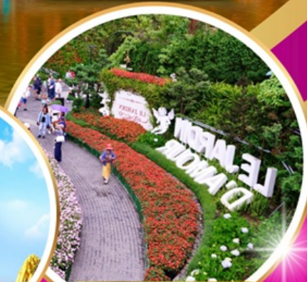
Le Jardin d'Amour