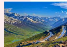
หุบเขา Naran Kaghan

** พักที่ Besham Hilton Hotel หรือเทียบเท่า **