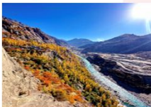
บ่อมปราการ Altit Fort

DAY4 บ่อมปราการอัลติท-ตลาดพื้นเมือง-ฮอปเปอร์ กลาเซียร์ -หุบเขาดุกเกอร์