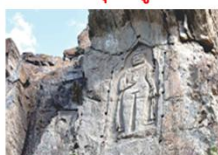
พระพุทธรูปคาร์กาห์

** พักที่ Kallisto Hotel หรือเทียบเท่า **