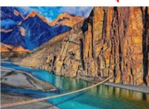
สะพานแขวนฮุสไซนี

DAY6 สะพานแขวนฮุสไซนี-กิลกิต-พระพุทธรูปคาร์กาห์