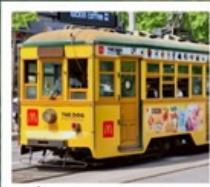
นั่งรถรางต้าเหลียน