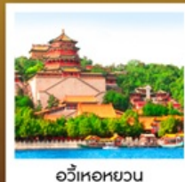
อวี่เหอหยวน