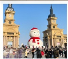
ดึกตาหิมะยักษ์