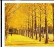
สวนเอ็กซ์โป