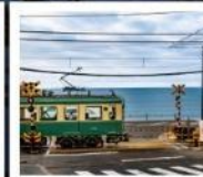
รถไฟเอโนะเด็ง